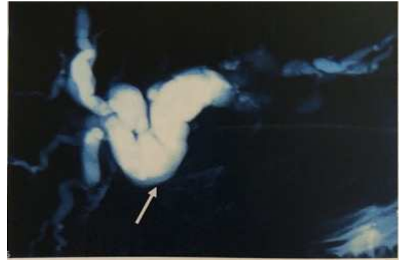
Figure 3 : Cholangio-IRM montrant une sténose de la VBP avec dilatation en amont (Flèche)