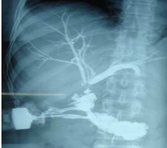
Figure 4 : Fistulographie montrant une fuite latérale au niveau de la VBP