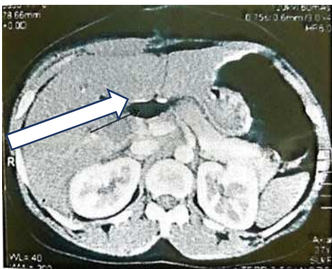
Figure 1 : Dilatation voies biliaires au niveau de la convergence supérieure sans dilatation des voies extra-hépatiques (flèche).